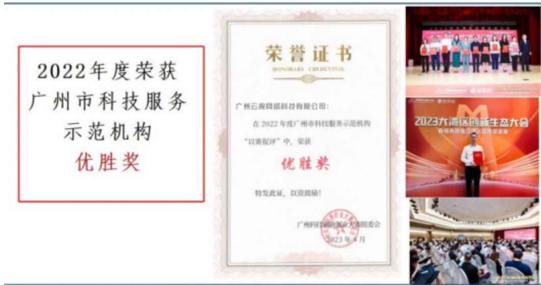
荣获广州市科技服务示范机构优胜奖（入围企业共 1500+，云搜 TOP30）