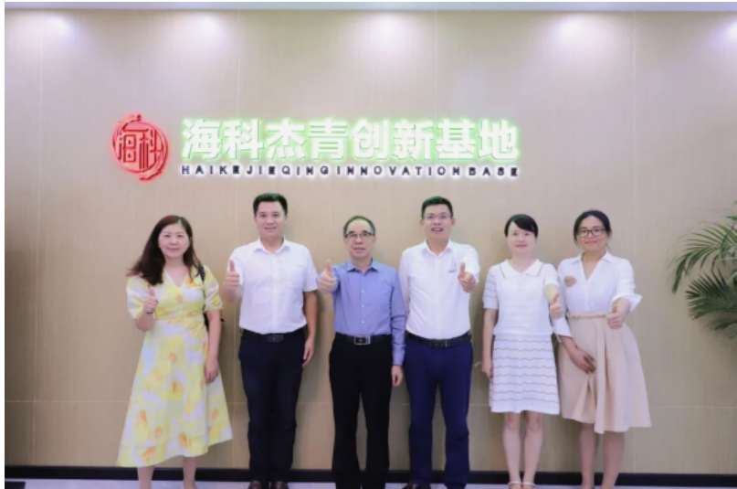
“知产宝”与海科杰青创新基地 达成整体资产规划