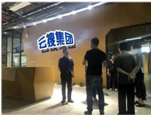
广东省科技领导莅临云搜 集团调研

平台推出先协助企业成功申请到补贴款项后再收取服务费 ， 让企业更放心，让企业 高效、低成本申请政府补贴资金！