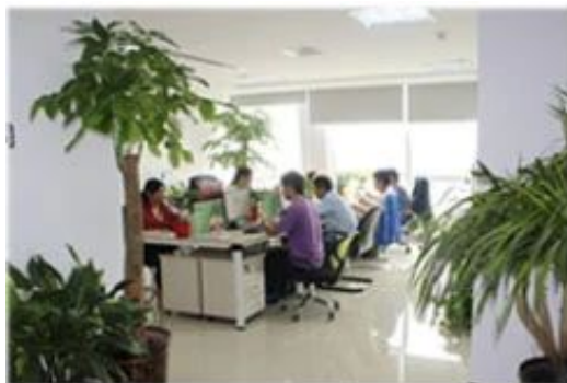
环境优雅的技术部

截止 2023 年 12 月，“建站宝”凭借着优质的技术、完美的售后服务、快速的功能更新以及优秀市场推广支持，在国内已经拥有众多代理商平台及 50000 余家企业客户。