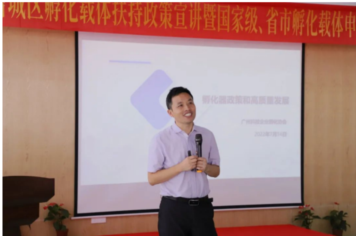
一站宝工程师对孵化器政策解读