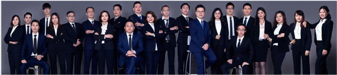
云搜集团“项目宝”团队合照

“项目宝”通过汇集“国家科技部、工信部、发改委、科协、财政部、教育部等十多个部委，省科技厅、财政厅、工信委、教育厅、发改委等多个政府及省各个地级市、各个行业的科技新闻、科技动态、科技通知、科技政策、税收优惠政策，通过对国家、省、市层面；电子、机械、环保、软件等多个行业的信息资源的融合，为企业提供及时性的“信息资源窗口”；融合成“一站式科技创新服务体系”！为中小企业的创新发展助一臂之力！