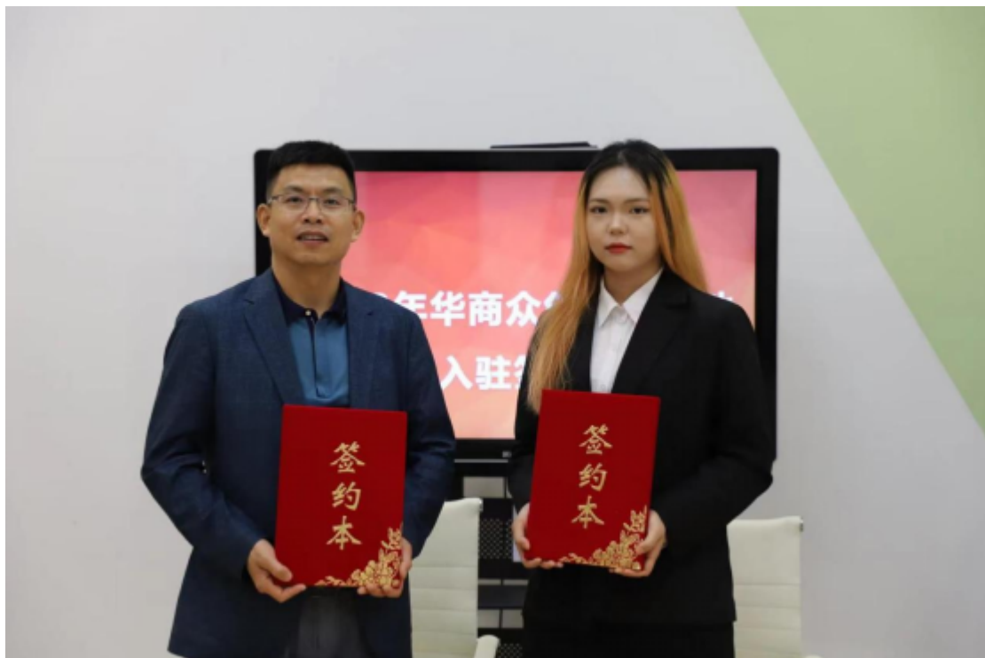
云搜集团与华商众孵化基地签约