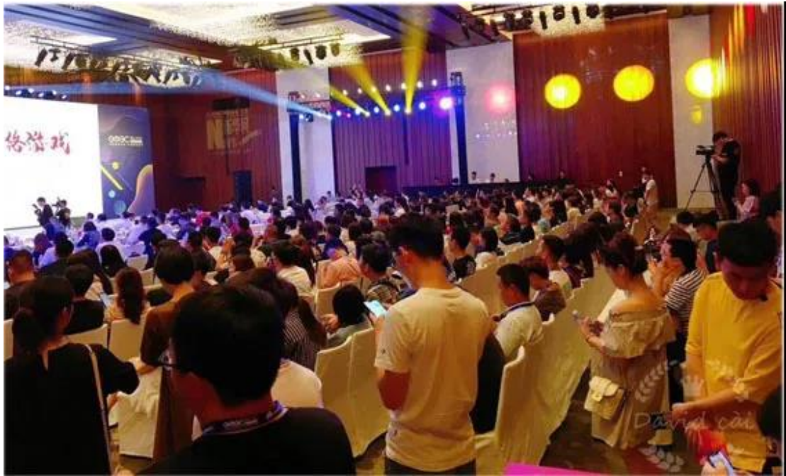
云搜集团协助广东省科协举办“高新企业认定”政策宣贯活动