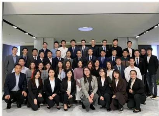
“项目宝”项目人员合照